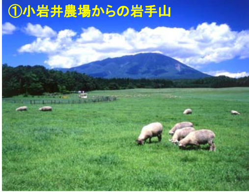
①小岩井農場からの岩手山